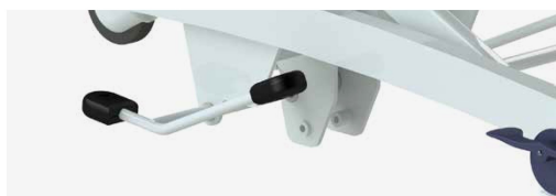
Sterowanie wysokie / niskie (hydrauliczna Marina).

Marina deluxe jest standardowo wyposażona w wbudowaną regulację długości, dzięki czemu leżankę można łatwo wydłużyć lub skrócić.