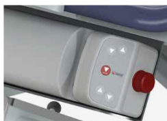
Zatrzymanie awaryjne skrzynki sterowniczej (Electric Marina)