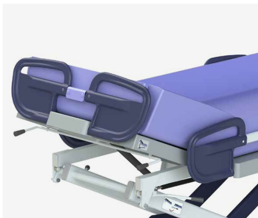
Elektryczna lub gazowa regulacja oparcia (Marina deluxe).