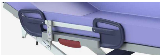
Szyna boczna z obniżoną częścią środkową zapewnia optymalną pielęgnację.