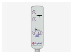
Sterowanie pilotem ze wskaźnikiem naładowania baterii (Electric Marina).