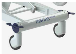
Półcentralny układ hamulcowy.