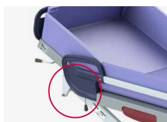
Pozycja pod kątem (anty-Trendelenburg)