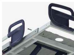
Ze standardową wbudowaną regulacją długości.