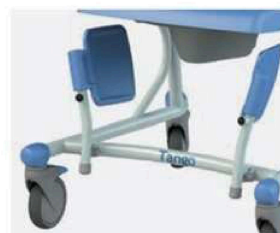
Składane i odchylane podnóżki.