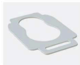
Opcja: Uchwyt na basen jednorazowy (nr kat. 6950 1110).