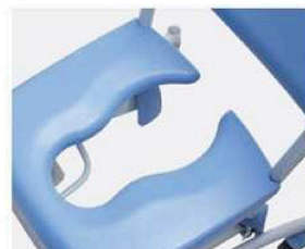
Deska PU z otworem na toaletę.