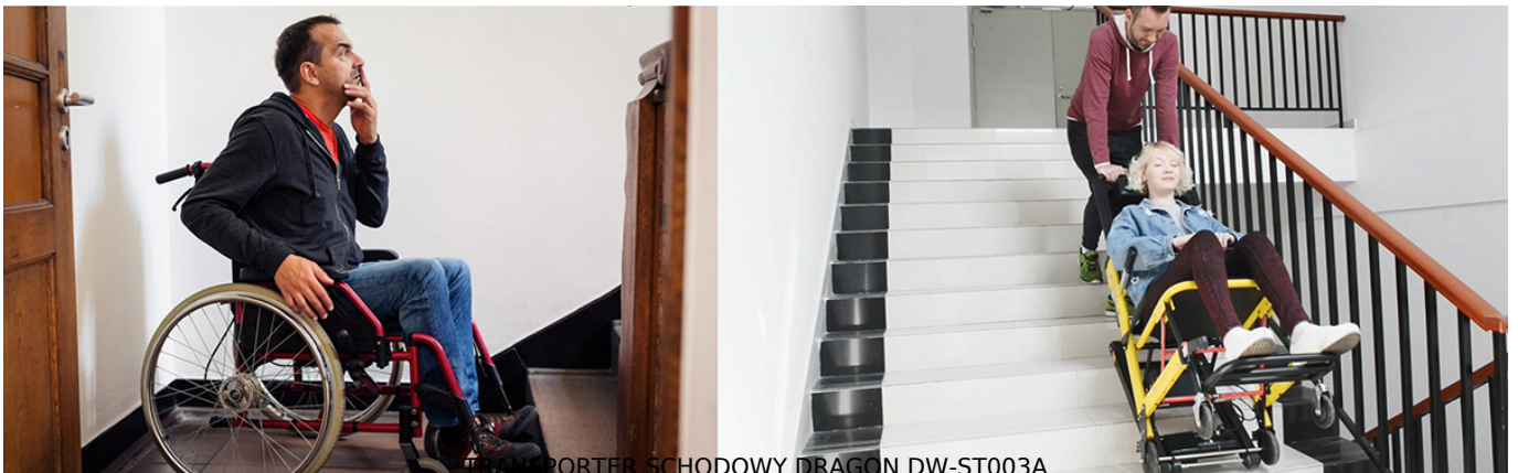
zmotoryzowane krzesło schodowe

Od 20 lat jesteśmy wiodącym dostawcą produktów związanych z mobilnością osób niepełnosprawnych w obiektach architektonicznych pozbawionych podjazdów, platform lub wind.