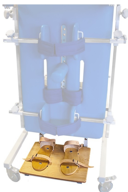
Podest z sandałami stabilizującymi Sandały zapinane są na skórzane pasy.