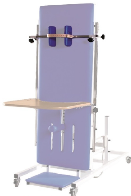
Stabilizacja głowy Pufki stabilizujące głowę wyposażone w pasek skórzany