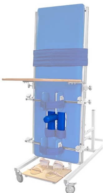
Banan stabilizujący Podpora stabilizująca w okolicach "krocza".