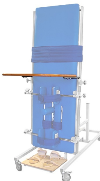
Stolik Błat do ćwiczeń manualnych