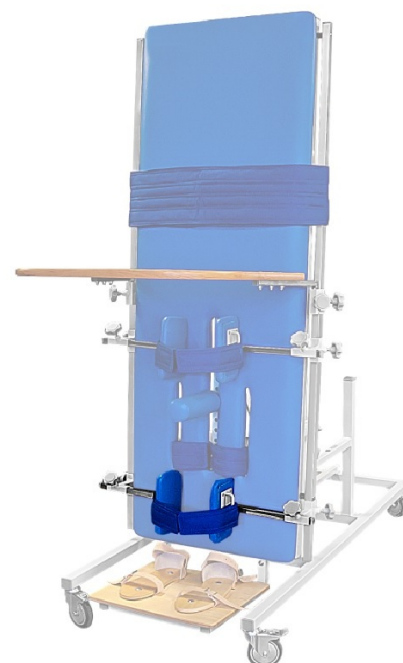
Stabilizacja kończyn dolnych Pufki stabilizujące kończyny dolne