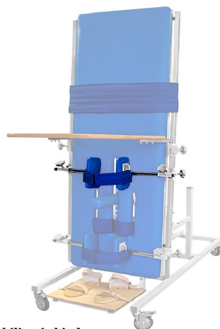
Stabilizacja bioder Pufki stabilizujące biodra/ miednicę