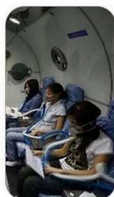
słaba efektywność hipoksja studentów