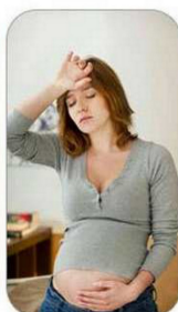
niedotlenienie płodu u kobiet w ciąży